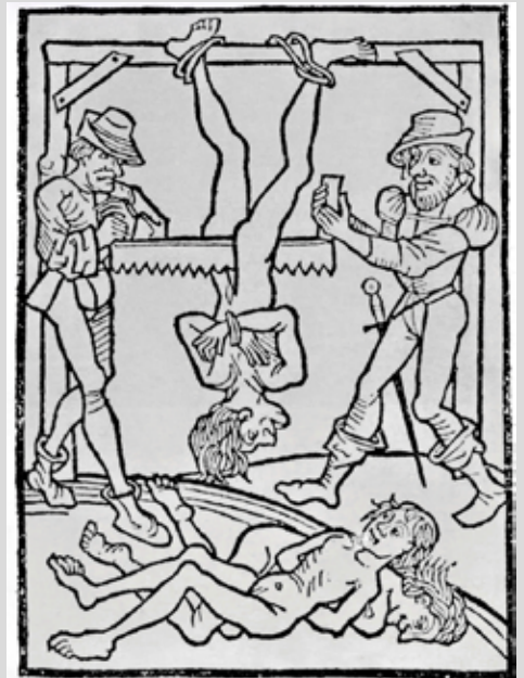
Straf voor homosexualiteit, uit Grotius, Speculum abominatum in oculis Domini 1474