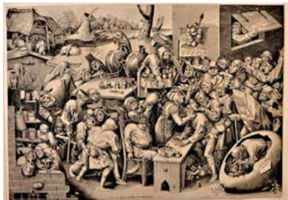
Pieter van der Heyden naar ontwerp van Pieter Bruegel I, De heks van Mallegem, gravure, Groeningemuseum, Brugge.

Met de aankoop van de collectie van de Brugse prenthandelaar Guy Van Hoorebeke werd het Groeningemuseum in 2014 eensklaps ruim 2000 prenten rijker. In de verzameling is de internationale top van de grafiek vertegenwoordigd met werken van beroemde meesters als Bruegel, Rembrandt, Piranesi, Goya, Ensor en Alechinsky. Hoogtepunten uit de indrukwekkende collectie zullen te zien zijn in het Groeningemuseum en het Arentshuis van 31 oktober 2015 tot en met 19 juni 2016. In deze lezing behandelen de sprekers enkele bijzondere prenten(groepen) uit de selectie oude prentkunst.