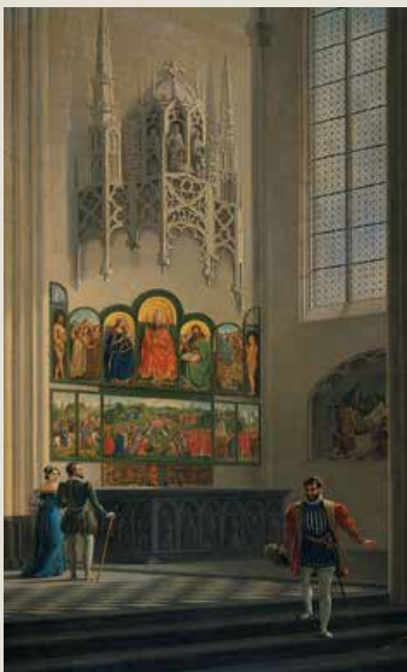
Frans de Noer, Het Lam Gods in de Sint-Baafskathedraal in Gent, ca. 1829, Amsterdam, Rijksmuseum