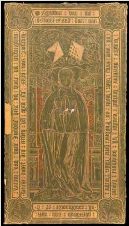
Wrijfprent van de grafsteen van Florentine Wielant, Gruuthusemuseum, Foto Dominique Provost

Het Lam Gods werd in de loop van de tijd verschillende keren gedemonteerd en delen van de originele constructie, zoals de lijsten van de centrale panelen, zijn verloren gegaan. Er is geen bewijs dat de huidige presentatie van het beroemde veelluik authentiek is. Deze opstelling bevat namelijk een aantal paradoxen. Wetenschappers hebben reeds verschillende andere reconstructies voorgesteld. Griet Steyaert, die deel uit maakt van het KIK- team dat het Gentse altaarstuk van de gebroeders Van Eyck restaureert, publiceerde onlangs een nieuwe hypothese in 'The Burlington Magazine'.